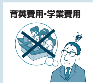
育英費用・学業費用

扶養者に万一のことがあった場合 ●学生の生活費を補償(育英費用) ●学生の卒業までの授業料等を補償(学業費用)