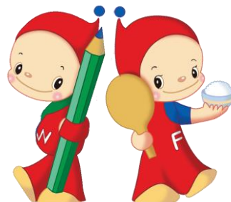
ウェルくん フェアちゃん