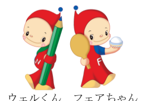
ウエルくん フェアちゃん