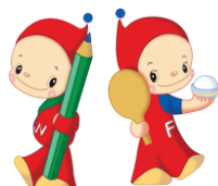
ウェルくん フェアちゃん